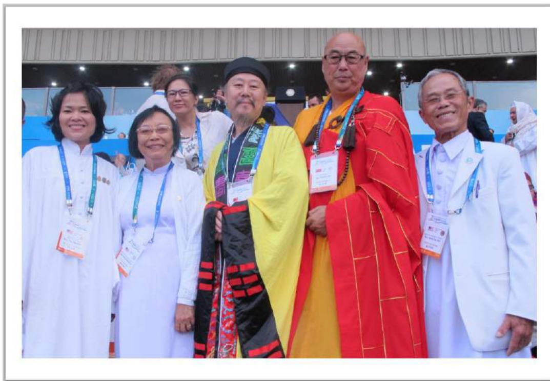
@Peace Summit 2016 – S. Korea