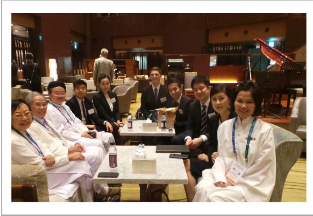
@Peace Summit 2016 – S. Korea