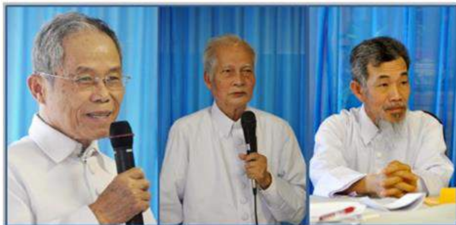
@ ĐH Cơ Quan Đại Diện Lần Thứ 3 – Tháng 9 Năm 2016 (TTCD - Houston TX)