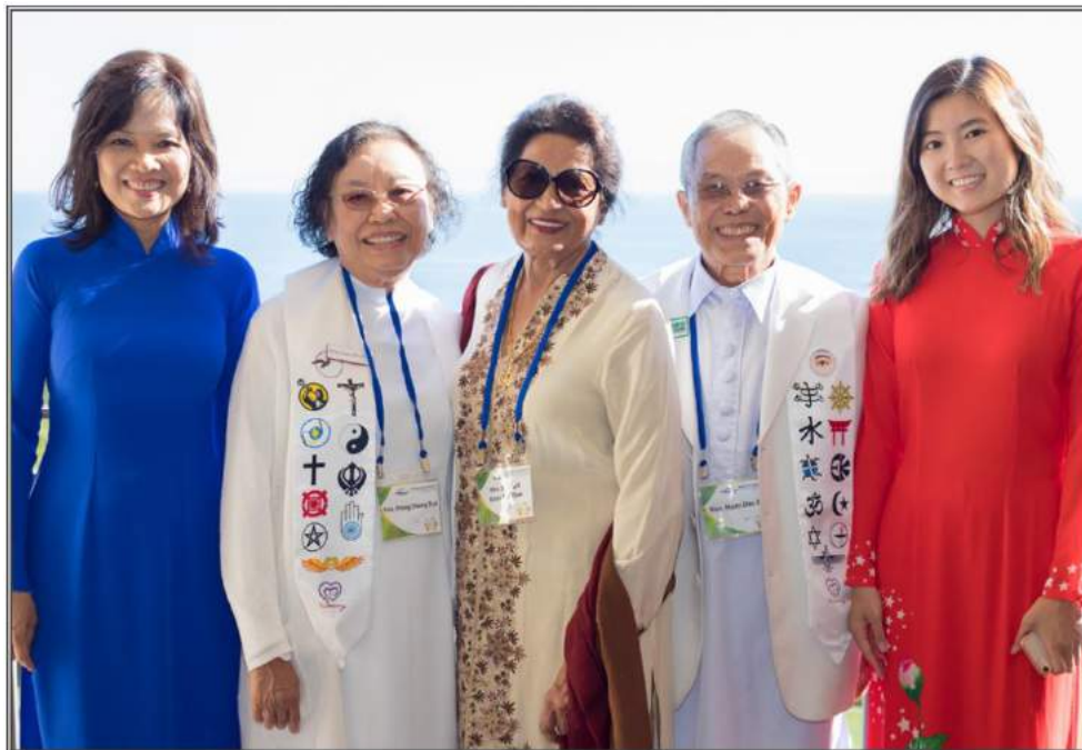
@Peace Summit 2019 – Los Angeles CA