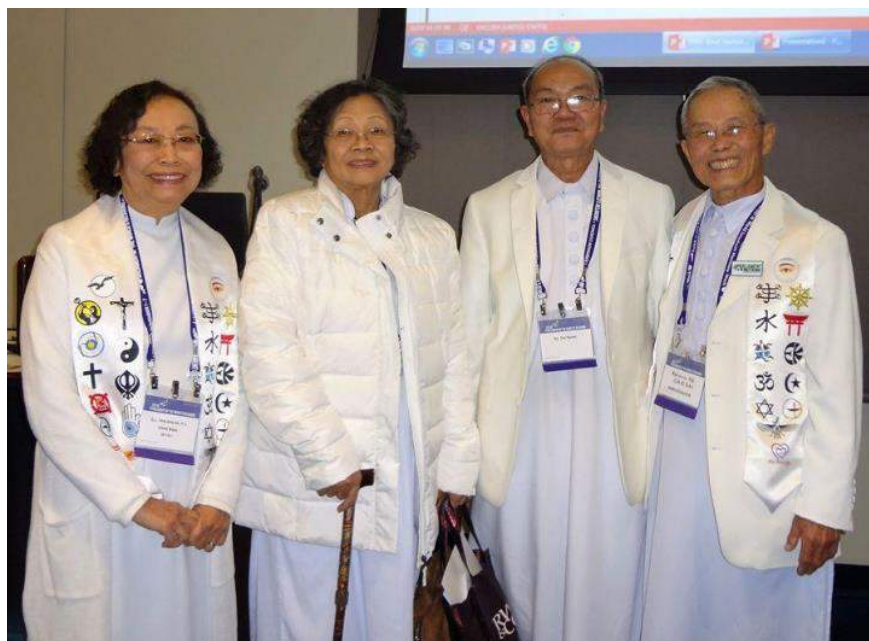
@ Parliament of World Religion 2018 - Toronto Canada