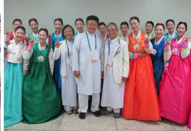
@Peace Summit 2016, 2019 – Los Angeles and S. Korea