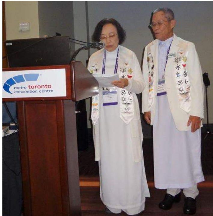
@ Parliament of World Religion 2018 - Toronto Canada