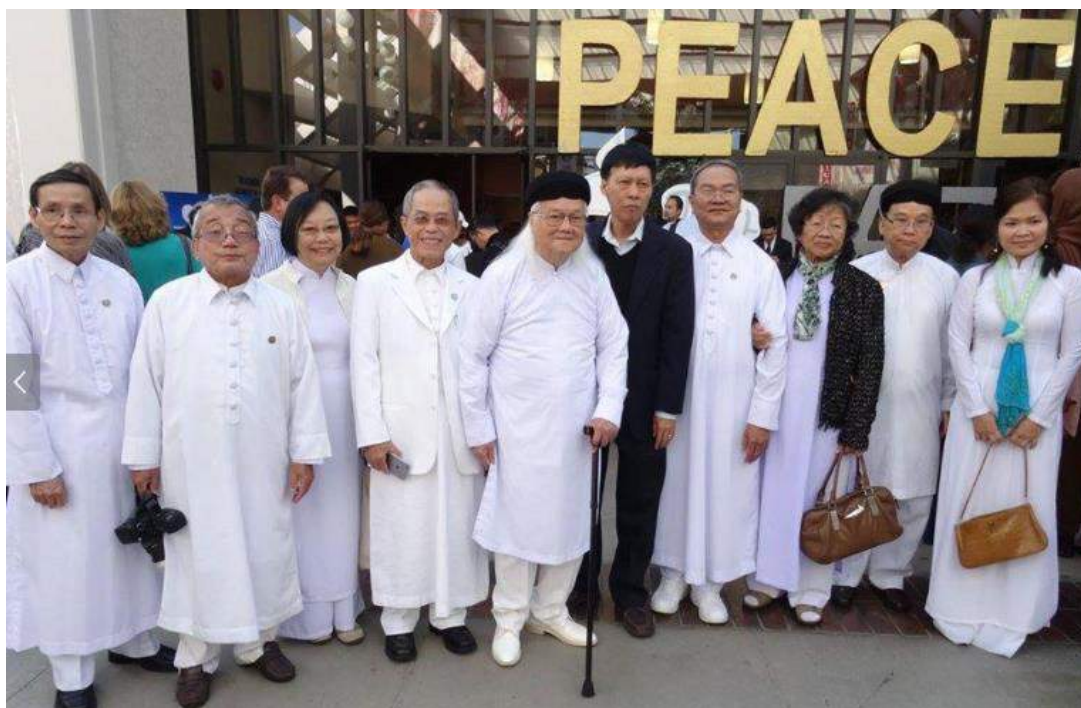
@ Peace Conference 2015 – Los Angeles CA