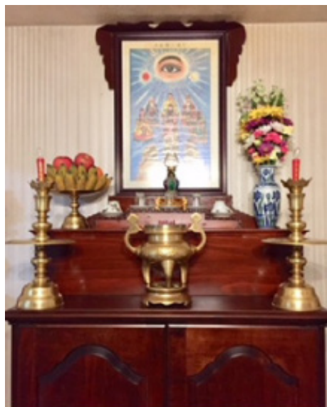
Thiên bàn thờ Đức Chí Tôn tại tư gia

Nói chung, tùy theo hoàn cảnh, thờ kiểu bàn thờ nào cũng được miễn là sắp đặt các món lễ vật sao cho đúng theo lời chỉ dẫn của Hội Thánh.