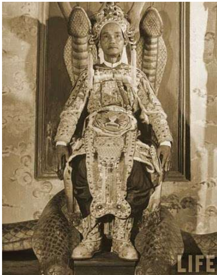
Đức Hộ Pháp Phạm Công Tắc

MỘT BỘ THÁNH KINH QUAN TRỌNG CỦA CAO ĐÀI GIÁO.